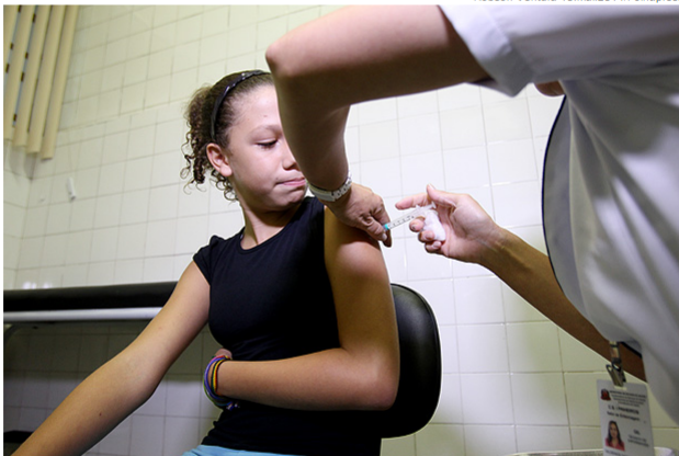
Menina recebe vacina contra HPV na Casa do Adolescente, em Pinheiros