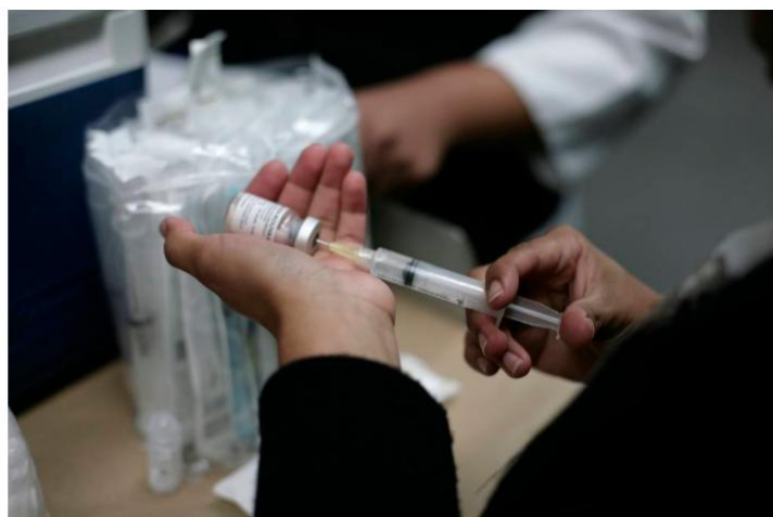
Adultos também podem se vacinar